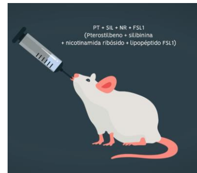
Imagen 2. Administración in vivo de la fórmula radioprotectora y mitigadora