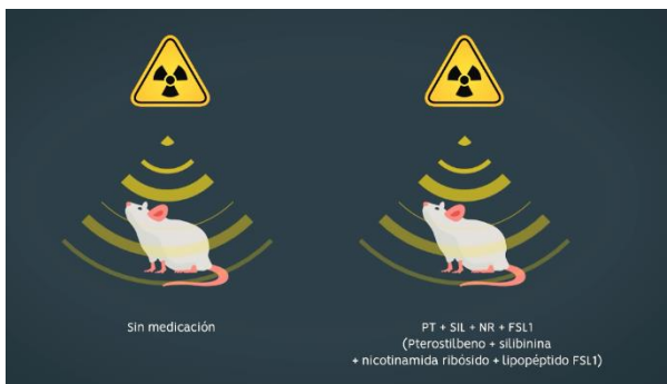
Imagen 1. Exposición a la radiación ionizante a cuerpo entero en estudios in vivo con y sin la fórmula radioprotectora y mitigadora.